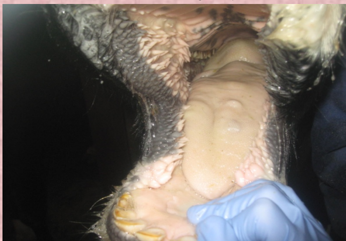
口内の水ぶくれ(初期の症状)