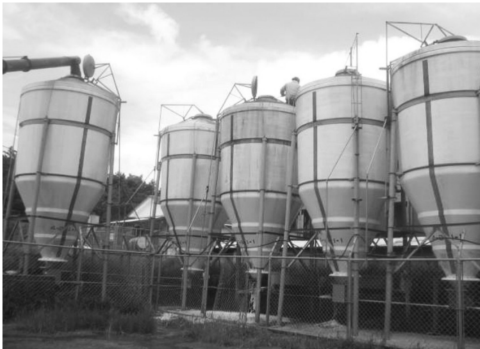
写真2 農場フェンス越し飼料入庫

各豚舎タンクへの搬送ラインまたは農場内専用バルク車の常備が望まれます（写真2）。