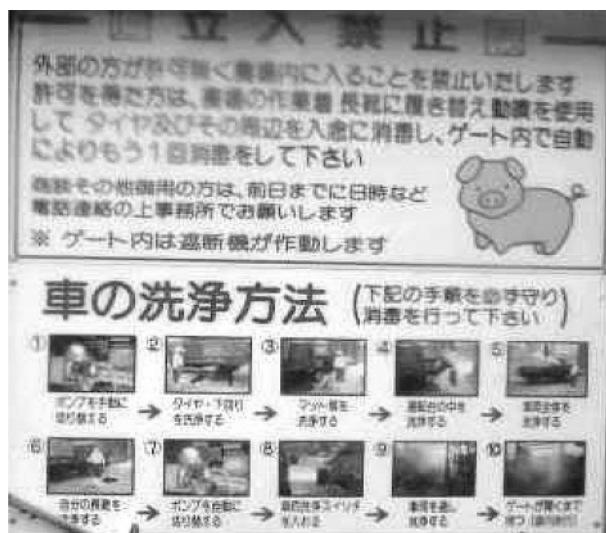
写真1 消毒入門門消毒洗浄手順説明掲示

ないかもしれません。自家更新で候補豚を選別する場合も野外抗体陰性のチェックは必要です。