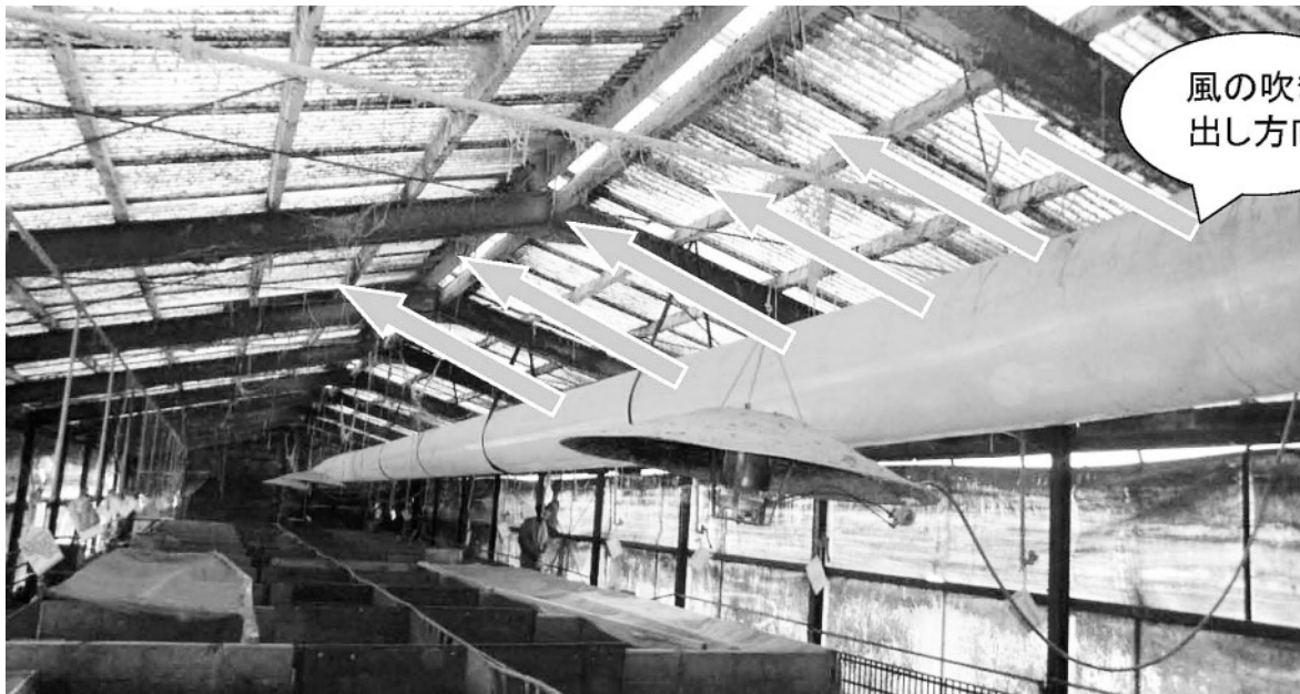
写真4 ガスブLOWERを熱源とし、ダクトによる陽圧換気を行っている古い離乳舎。ダクトの吹き出し口は上向きにして上部の暖気を下方に循環させている。