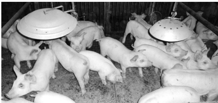
写真1 ゴムマットの上にガスブルーダーを設置して保温している。

溶かすより電解質液を使用するとより効果的です(写真2)。給餌器の食い口については、離乳までは一頭一頭専用の乳首を持っていたわけですから、口数はできる限り多いほうがストレスは少なくなります。少なくとも三頭に一口は必要だと考えます。