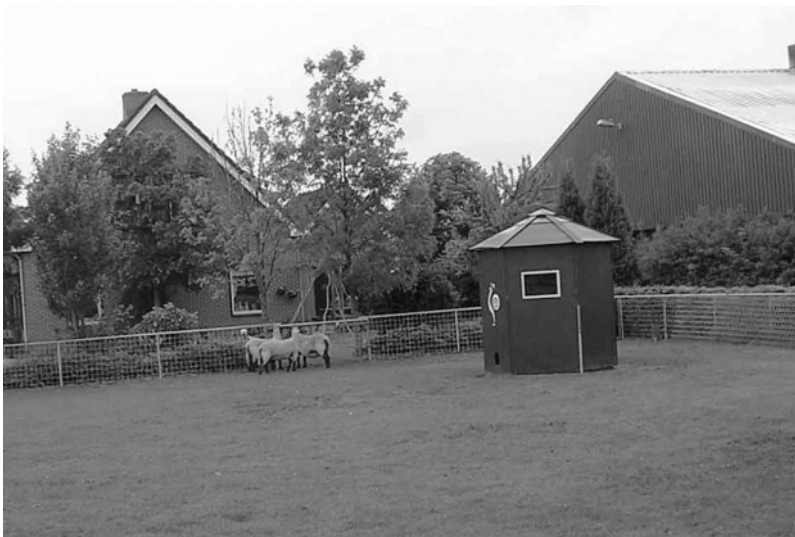
写真4 緑に囲まれた養豚場