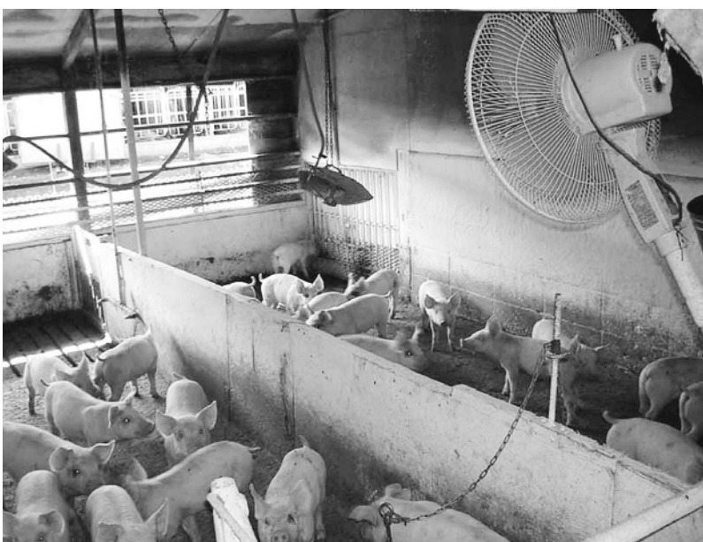
写真6 扇風機設置子豚舎

④天井の取り付けと天井の熱気抜き 天井のない豚舎は、直接屋根を通 があります。特に天井がなく断熱材 の不十分な豚舎での使用をお薦めし ます。さらに、軒下に寒冷紗を垂ら して屋根から落ちる水を受けるとさ らに効果が上がります。川から水を 引いての利用で経費の節約も可能で す。