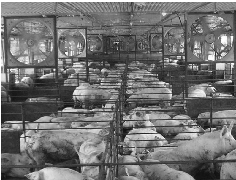
写真5 順送ファン設置肥育舎