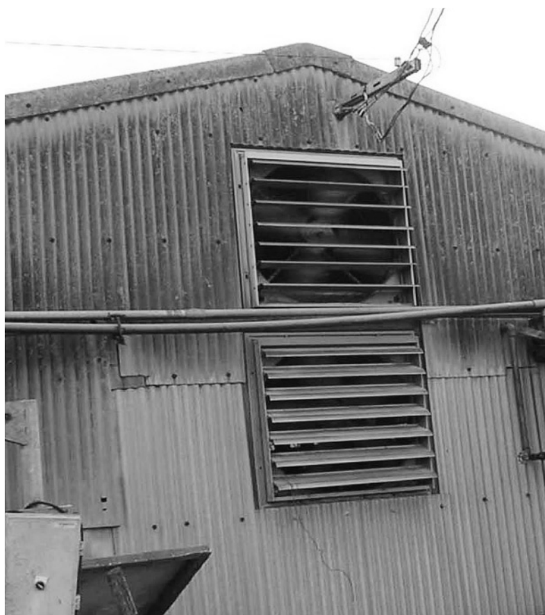
写真3 天井裏換気扇と室内換気扇

湿時には威力は十分に発揮されませんが、高温晴天時には非常に効果的です。暑熱季全般を通して考えてもよい方法と思われます。断熱の不十分な豚舎やカーテン式豚舎でも簡単な改造で十分設置が可能です。