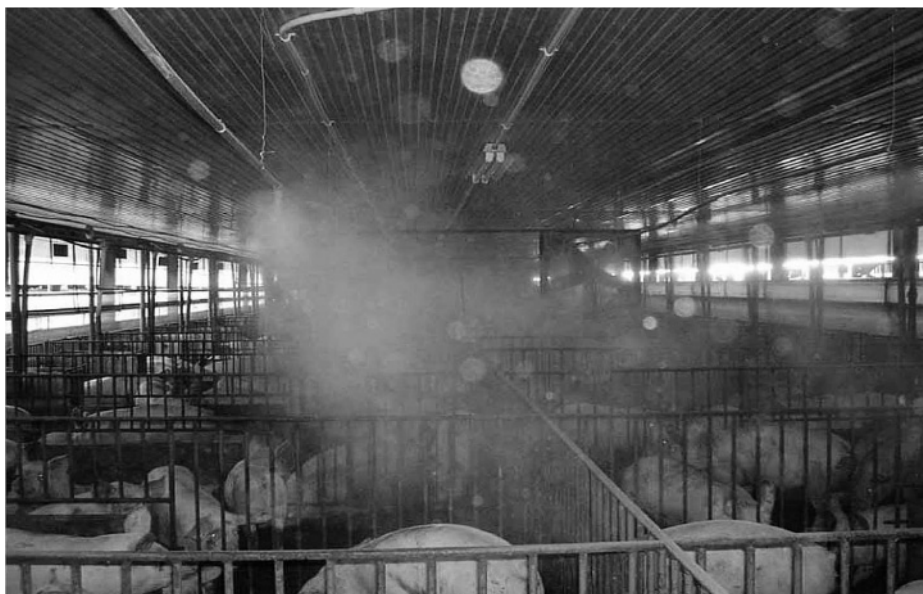
写真2 肥育舎の細霧装置

いる管理者がいます。子豚は離乳や移動などのストレスを受けると食欲が減退し、栄養不足となり通常の適正温度では寒く感じて発育の遅れ、免疫機能の低下を起こして疾病に罹りやすくなります。図1に日齢別の