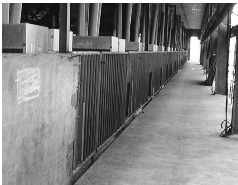
写真7 コンパネ取り外し可能柵

の乾燥、ほこり防止にもつながります。しかし、豚舎周囲1m以内の草木は空気の流れを悪くするばかりでなく、ネズミの侵入を容易にしますので厳禁です。