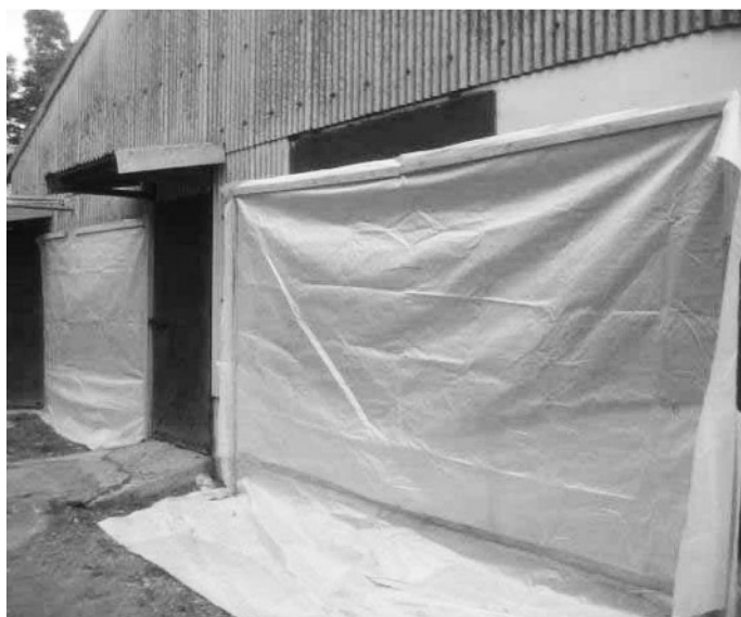
写真2 シートによる豚舎外からの隙間風防止

ラブルや凍結による断水はできる限り ないよう、日常の点検と調整、移 動後からストールの飲水器の分解洗 浄を怠ることはできません。