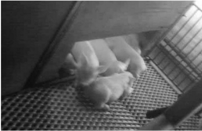
写真3 分娩舎保温箱 (自由に場所が選べて幸せそうな寝姿)