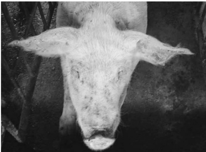
写真4 スス病的母豚