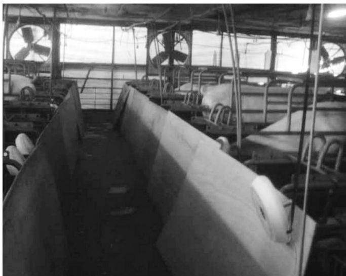
写真1 ベニヤ板による直接の風の防止